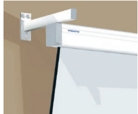
Soporte de separación

El puntero láser tipo bolígrafo de robusto diseño y para uso prolongado. Alcance 80 metros. Punto proyectado de color rojo. Peso: 21 gr. (sin pilas). Pilas: 2 x AAA. Color: Plata